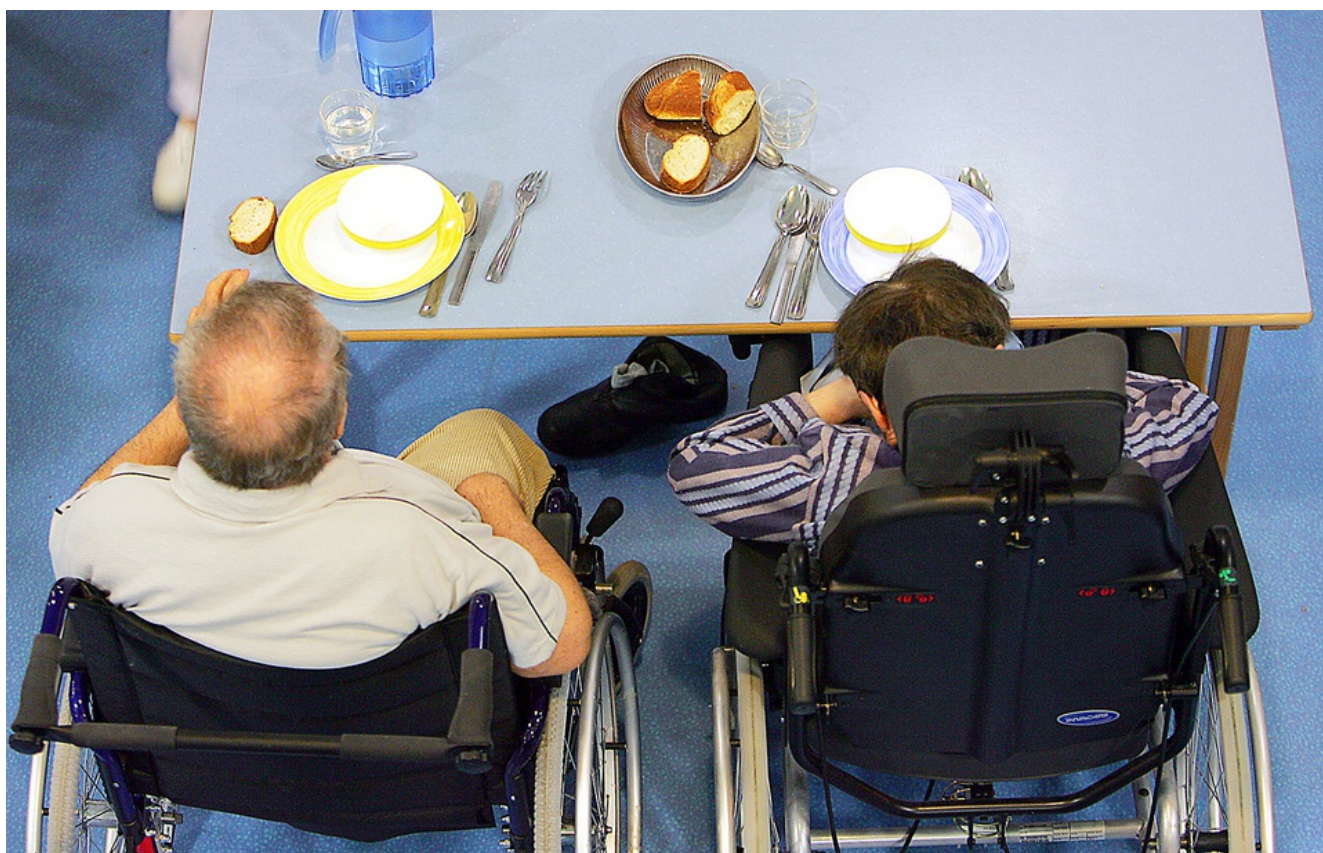
La prise de repas dans une maison de retraite (illustration).

Beatrice Colin | 🕒 Publié le 02/04/19 à 11h59 — Mis à jour le 03/04/19 à 15h37