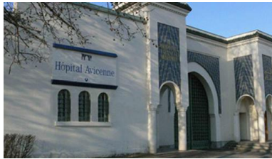
L'hôpital Avicenne.